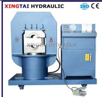
Гидравлический пресс 800 т, опрессовка канатов до 52 мм