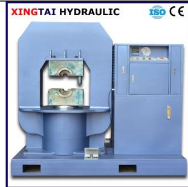
Гидравлический пресс 1000 т, опрессовка канатов до 56 мм