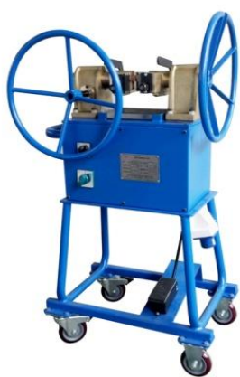
Машинка для отрезки и обработки концов канатов Модель №: RD-1010 Обработка канатов диаметром 3-16 мм