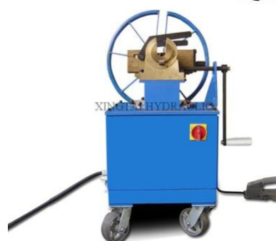
Машинка для отрезки и обработки концов канатов Модель №: RD-1010 Обработка канатов диаметром 3-16 мм