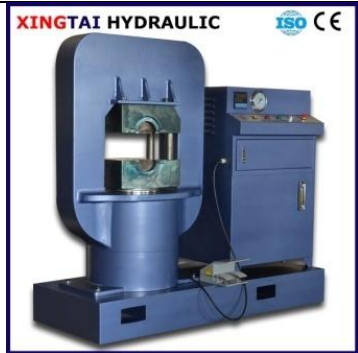
Гидравлический пресс 650 т, опрессовка канатов до 48 мм